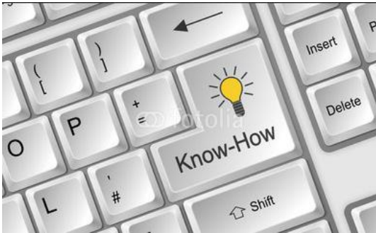
Tastatur Enter Know-How

für das Erstellen eines sechsseitigen Faltblattes mit Wickelfalz